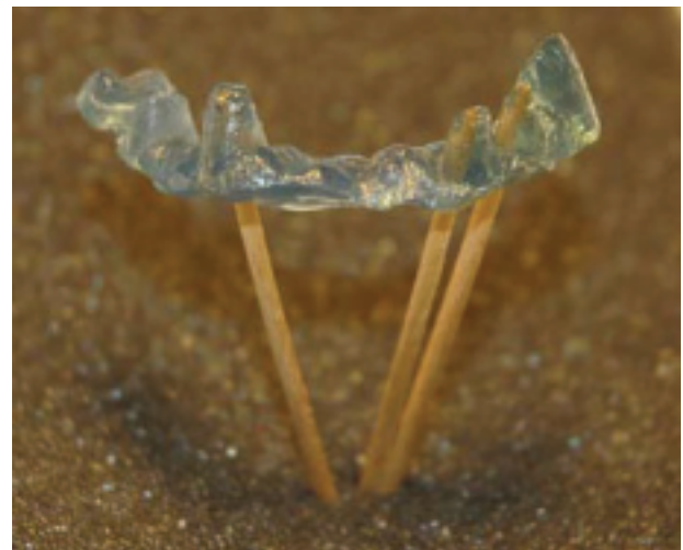
Kuva 4. Valmis suuntamalli.

(Dentsply, Triad Gel. 4 * 22 g. n. 90€ / Plandent ) Siltatyö D12-25