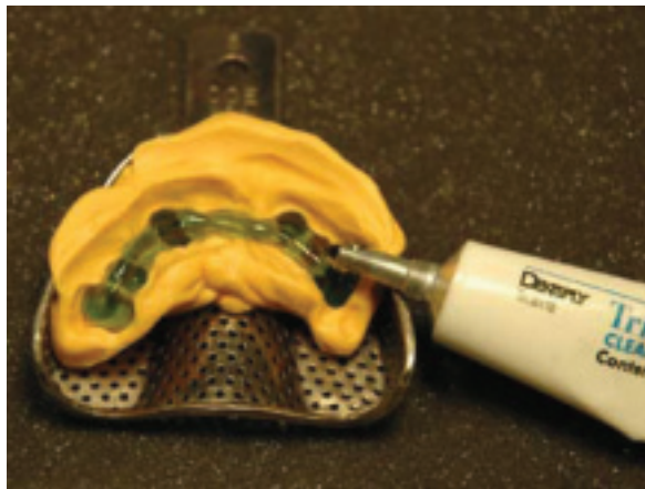
Kuva 2. Täytä kohde huolellisesti pilareiden pohjia myöten. -Vinkki: voit siirtää geeliä ruiskuun jossa on kapeampi kärki.