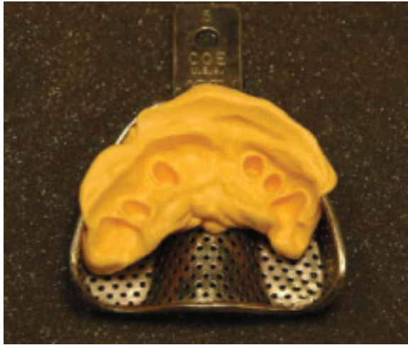
Kuva 1. Jäljennä tarkasteltava alue esim. alginaatilla tai puttyllä. Desinfioi ja kuivaa jäljennös.