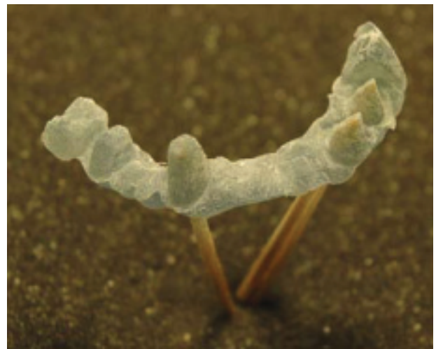
Kuva 5. Kipsimallimaisen mattapinnan saat pulveroimalla suuntamallin esim. kipsijauholla.